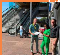
Samenwerking met NS